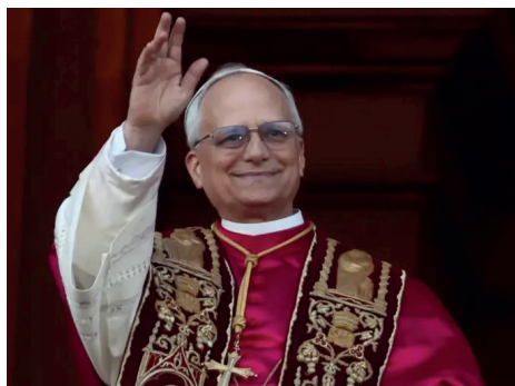
Papst Leo XIV.

wir leben in bewegten Zeiten - rund um die Osterzeit wurde Papst Franziskus unter großer Anteilnahme beigesetzt, eine neue Bundesregierung hat sich formiert, und im Vatikan wurde ein neuer Pontifex gewählt. Beten wir voll Hoffnung für Papst Leo, dass er unsere große Weltkirche mit Kraft und Weitblick in die Zukunft führen wird. Möge der Heilige Geist ihn auf seinem Weg begleiten!