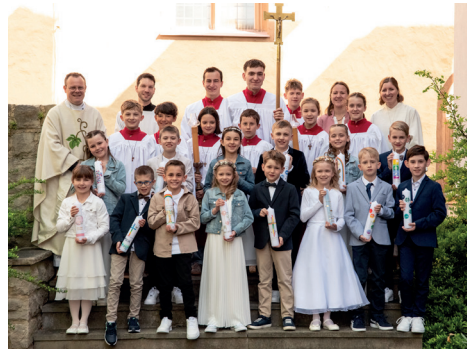
Die Kommunionkinder aus Erlabrunn und Margetshöchheim