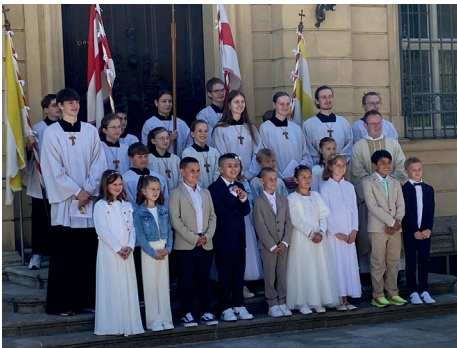
Die Kommunionkinder aus Zell