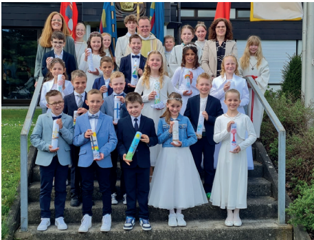
Die Kommunionkinder aus Linach