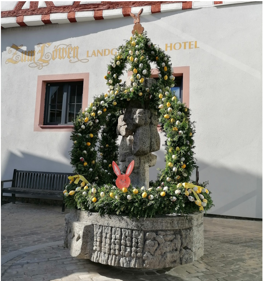
Osterbrunnen in Erlabrunn