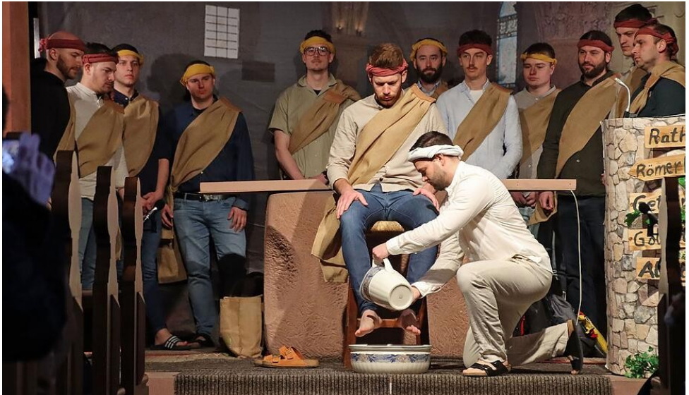
In und um die St.-Laurentius-Kirche veranstaltete das Familiengottesdienst-Team /Gemeindeteam der PG Leinach am Palmsonntag erstmals mit der Leinacher Passion eine zeitgemäße Version der Leidensgeschichte Jesu.