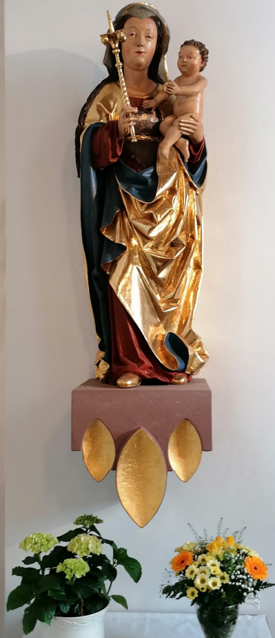
Muttergottes-Statue in der Kirche St. Laurentius, Leinach

„Maria, Maienkönigin, dich will der Mai begrüßen. O segne ihn mit holdem Sinn und uns zu deinen Füßen.“