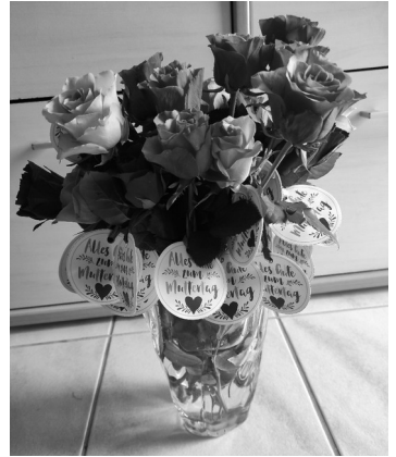
Ein Blumengruß für alle Mütter

Dieses wurde im Gottesdienst - verbunden mit persönlichen Dankesworten an die Mütter - im Chor vorgesungen. Anschließend überreichten die Kinder jeder Frau eine Rose mit lieben Wünschen zum Muttertag.